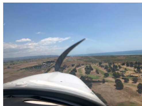
Landing te Whakatane

Wij zijn gewend dat een compleet horeca leger in het vliegveld restaurant voor ons klaarstaat na de landing en dat valt hier tegen. De uitzondering is Waihi Beach. Een gras strippie van 650 meter waar iemand toevallig een prima koffieshop naast heeft gezet. Het is een klein uur vliegen uit Whakatane dus deze keer de Bristell na de landing van de rescue heli aan de grond gezet en genoten van heerlijke koffie met mudcake. Nog even een praatje met de lokale vliegers die in de hangar bezig waren om een eigengebouwde kist in elkaar te zetten alvorens tussen de heuvels door en langs de CTR van Tauranga weer terug te vliegen.